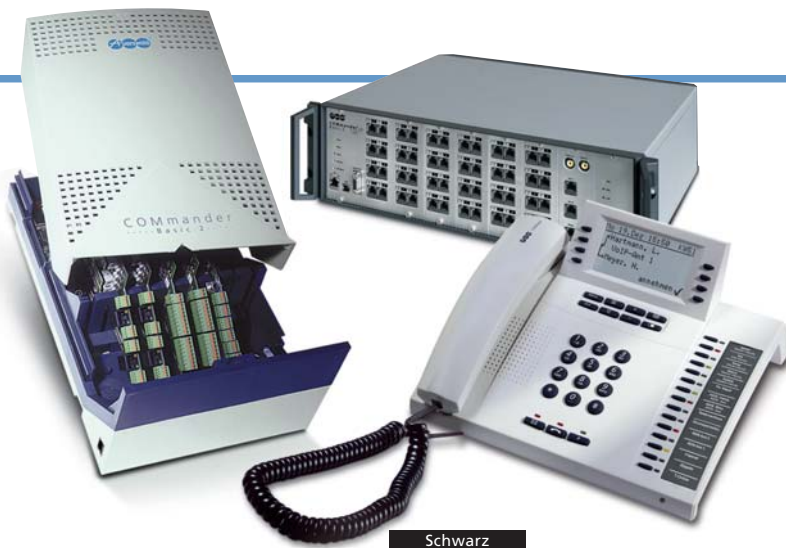
Schwarz Lichtgrau (weiß) Dunkelblau Die COMfortel-Systemtelefone stehen in diesen 3 Farben zur Verfügung.